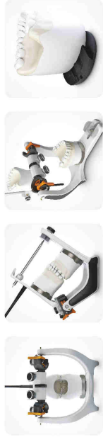
Visibilité large Inclinaison à 45° Ouverture à 180° Système de rail

Le développement de nos articulateurs est basé sur de solides recherches dans des écoles dentaires nationales et internationales afin de correspondre aux attentes essentielles des leaders d'opinion, et garantissant des caractéristiques déterminantes de rapidité, de qualité d'occlusion, d'adaptabilité ou d'esthétique. Notre design innovant offre une visibilité large, et permet un travail sous différents angles. Les modèles A7 s'ouvrent à 180° sans séparation des cadres. Quant aux plaques de montages, elles disposent d'un système d'attache magnétique éliminant ainsi la nécessité de visser et dévisser les modèles sans arrêt, et rendant l'utilisation facile, rapide et efficiente.