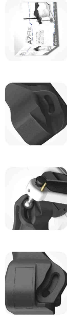
Guides incurvés Fixation centrale Réglages : Bennet 15°, Pente condylienne 30°

Le modèle A7 Fix est réglé sur des normes standards moyennes, offrant ainsi une simplicité d'utilisation et une prise en main rapide. Il est unique au monde puisqu'il dispose de guides condyliens magnétiques, et offre une parfaite stabilité pendant les mouvements articulaires.