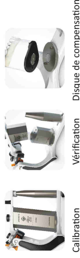
Calibration Vérification Disque de compensation

Les modèles A7 Plus et A7 Fix peuvent être standardisés / calibrés afin de permettre d'interchanger les empreintes d'un articulateur vers l'autre. Cela facilite grandement le travail entre les services et évite les échanges d'articulateurs. Ce système de standardisation n'interfère pas dans les procédures d'assemblage, le dentiste peut alors conserver ses méthodes de travail traditionnelles.