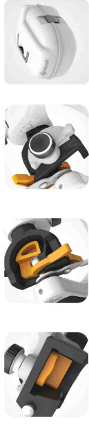
Guides incurvés Fixation centrale Ajustement angles de Bennet / pente condylienne

Pentes condyliennes et angles de Bennet ajustables par un réglage simple, rapide et gradué (grâce aux vis de réglage), le modèle A7 Plus est idéal tant sur le plan académique que professionnel. Avec plus de 400 000 exemplaires vendus à travers le monde, ce modèle est une référence.